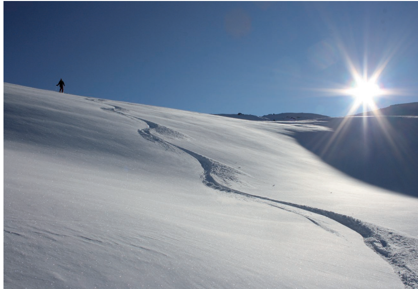
Unberührte Pulverhänge und wärmende Sonnenstrahlen verzaubern die kalte Winterlandschaft in ein Paradies der Hochgefühle.

Unsere beiden Skitourenvorschläge beginnen mit einen Waldabschnitt um später über Geländerücken dem Gipfelziel näher zu kommen. Oft liegt toller Pulverschnee an den Nordhängen und Mulden. Auf die Abfahrt darf man sich freuen!