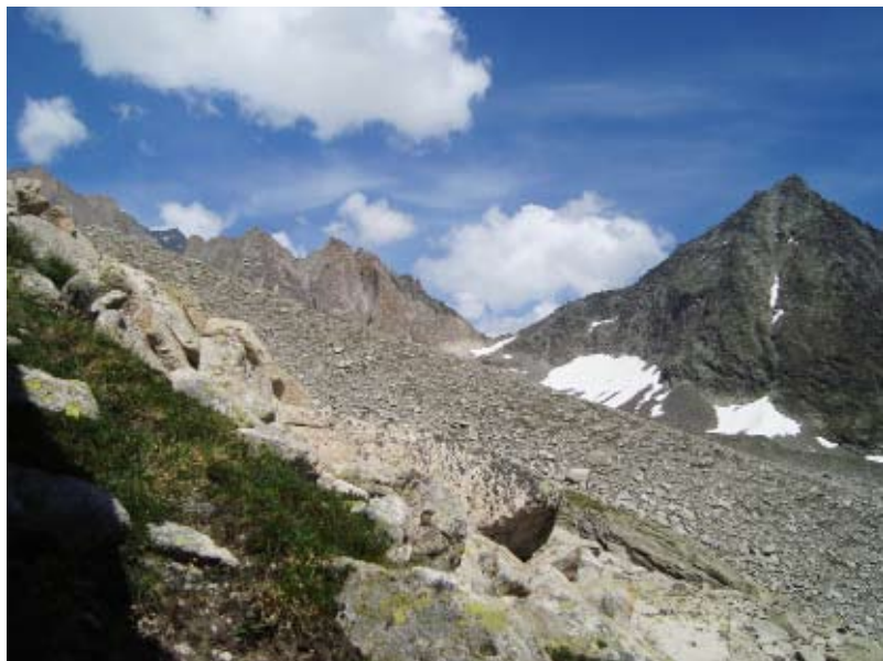
Vue sur le Grüebhorn (rocher foncé). A gauche, les Baltschiederhörner. Entre deux se trouve la Lücke 2989 m où commence l'ascension au Grüebhorn par l'arête nord.

Ausserberg est notre point de départ et après 6 à 7 heures de randonnée tranquille nous atteignons la cabane le premier jour. Le deuxième jour nous partons soit à l'aube pour faire l'ascension du Grüebhorn, un sommet avec quelques passages à "crapahuter", ou alors on fait la grâce matinée. Cela vaut par contre la peine de se lever tôt, car si l'on est de bonne heure au sommet, les lumières et la vue y sont les plus belles.