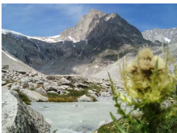
Photo à gauche: Vue en arrière vers la plaine avec le torrent Baltschieder. La cabane Baltschieder se trouve sous le Stockhorn. Photo à droite: Torrent sauvage, heureusement qu'il y a un pont vers Martischipfe.

Equipement de randonnée, éventuellement un piolet léger, cartes 1268 et 1288, topo guide Alpes bernoises 3.