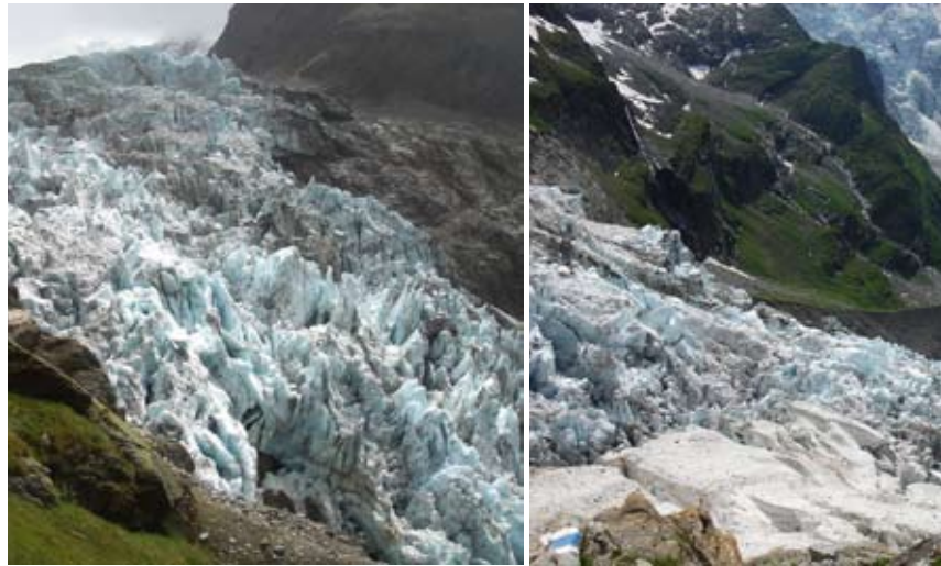
Magnifique vue sur le bas glacier de Grindelwald au lieu dit "Roten Gufer" sur le chemin d'accès à la cabane. Exceptionnellement sauvage, exceptionnellement proche.

Le réchauffement climatique a aussi laissé des traces dans cette région. Le restaurant Stiereneegg se trouve aujourd'hui à un nouvel emplacement. L'accès à la cabane a dû être également souvent déplacé. Plusieurs coulées torrentielles ont créé un ravinement profond sur le chemin d'accès et les responsables de la commission des cabanes sont souvent confrontés à de nouveaux défis. Sur le tronçon du "Roten Gufer" on est à la hauteur du très accidenté bas glacier de Grindelwald. Il est impressionnant d'observer les masses de glaces qui grincent et qui finissent par tomber. La traversée par l'arête Anderson avec descente par la voie normale est une course mixte à ne pas sous-estimer, qui commence à la lueur des lampes frontales et qui se termine, avec un peu de chance, par une portion de tarte avec de la crème chantilly. La montée dans un paysage sauvage ainsi que le granite solide et adhérent de l'arête SW, par laquelle on descend, caractérisent cette course adaptée aux alpinistes chevronnés.