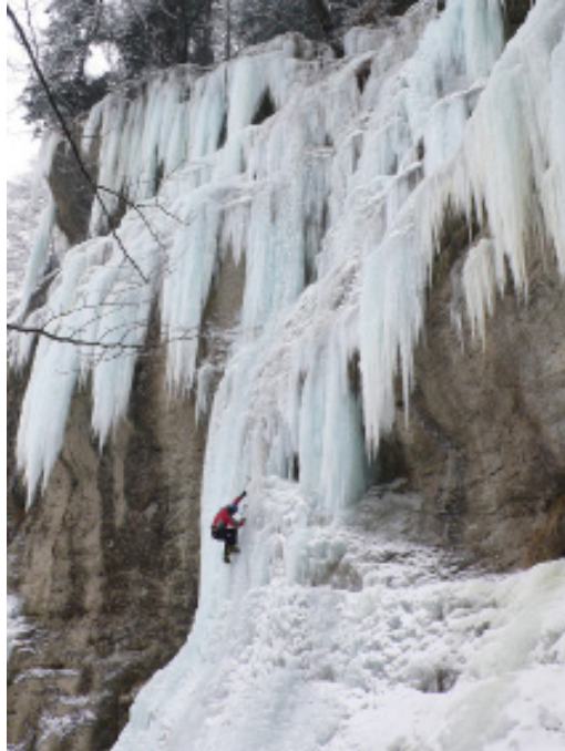
Das Eisklettergebiet "Schelmenloch" im Jura. Bild links: Das Jäggermannli. Bild rechts: Am Schönschelmen Links. Topo unten: Ausschnitt aus dem Topo des Führer "Winterwelt Jura".