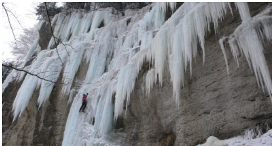
Paysage hivernal dans le Jura: Jonas Gesler au Schönschelmen. A gauche: site du Schelmenloch Wasserfallen (40m, II / 4).