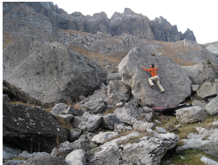
À gauche: Bloc avec vue sur les sommets. À droite: Au pays des pierres.