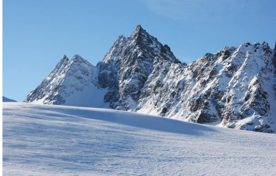
Bild recht: Eine einsame Spur über den Klostertaler Gletscher zum Gipfel zur Schneeglocke.

Bild links: Blick vom Silvretta-gletscher zum Verstanclahorn. Kein Skiberg. Dafür bietet das gleichnamige Gletschertal eine pächtige Abfahrt.