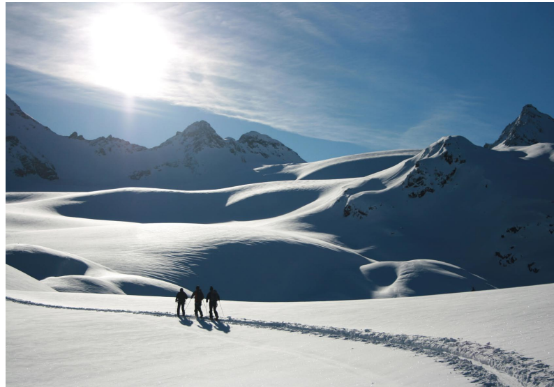
Die sanfte Gletscherwelt ladet ein, mit Ruhe über die weissen Flächen zu gleiten. Im Aufstieg zum Silvrettagletscher. Ein prächtiger Tag steht bevor.